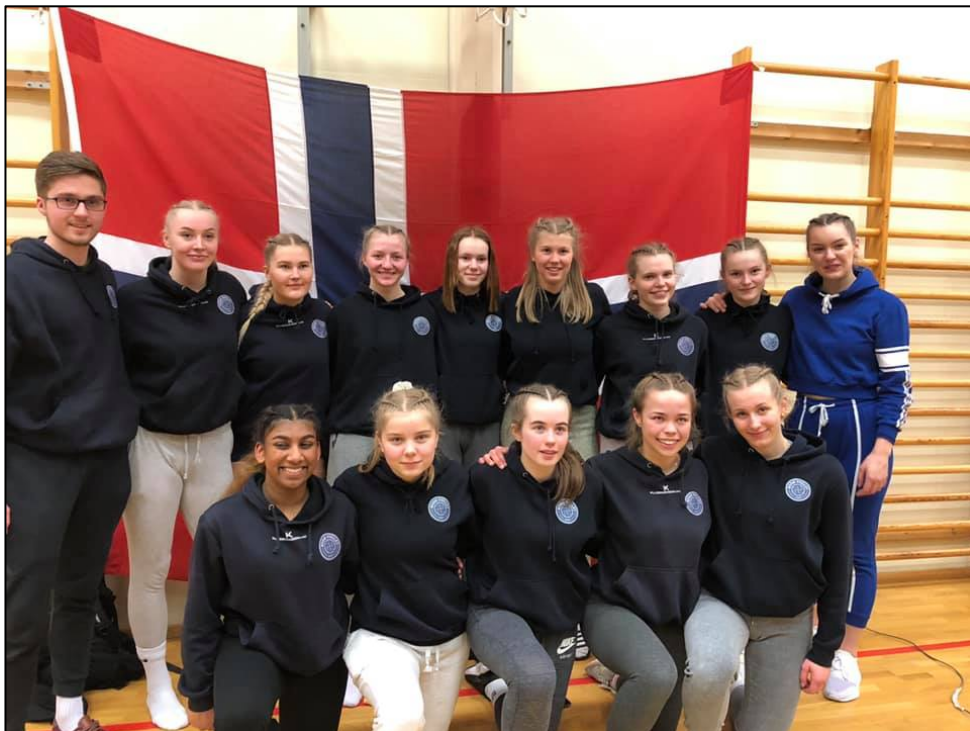
Gull-lag fra Nord – Bodø Volley JU17